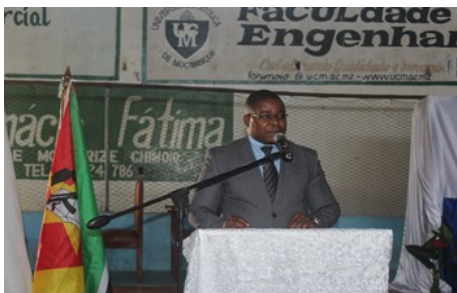
Mucave, Director Provincial, discursando

reiteramos o nosso apelo para a vossa disponibilidade, entrega e empenho para as funções que vos foram confiados nesta instituição. Queremos apelar à vossa maior contribuição para a formação de profissionais, que queremos altamente qualificados, desde a boa recepção e orientação dos novos estudantes, à sua boa integração na universidade e preparação como técnicos e profissionais, bem como, ao vosso acompanhamento e amizade após a graduação. A terminar, congratulamos, uma vez mais a UCM pelo empenho e abnegação nas actividades que lhe são atribuídas e, reiteramos o nosso encorajamento face aos desafios presentes e futuros.