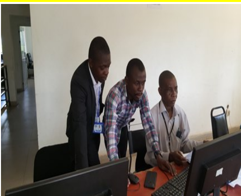
Acto de Lançamento de Dados

A Direcção Provincial da Ciência e Tecnologia, Ensino Superior e Técnico Profissional, através do Departamento Provincial de Ensino Técnico Profissional fez o lançamento de Dados das Instituições de Ensino Técnico Profissional na Província na Plataforma Gov-Ensino. Os Dados lançados