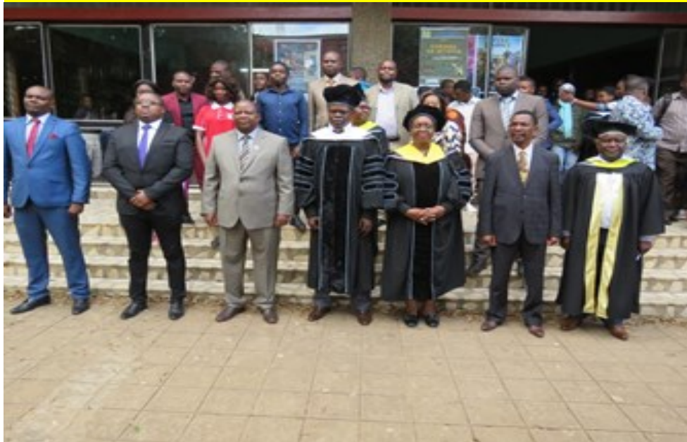
Foto de Família