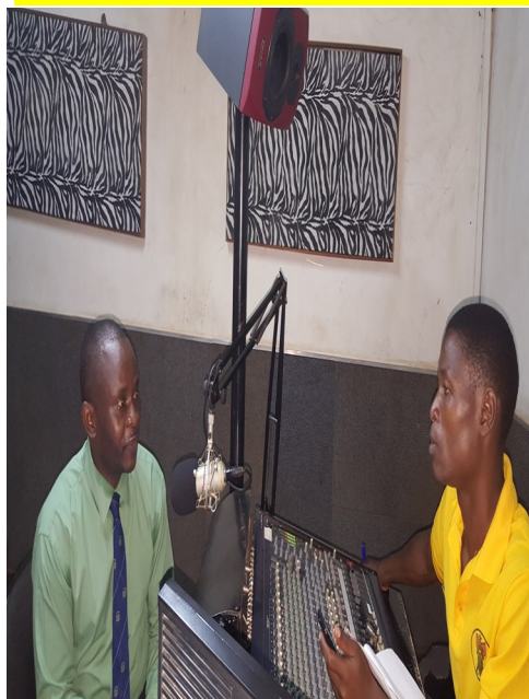
Entrevista na Rádio Com. Gesom

A Direcção Provincial da Ciência e Tecnologia, Ensino Superior e Técnico Profissional, através do Departamento Provincial de Tecnologia de Informação e Comunicação participou numa entrevista radiofónica na Rádio Moçambique-Delegação de Manica e Rádio Comunitária Gesom, onde o teor era o Estágio do funcionamento da Govnet na Província de Manica. De referir, que essa actividades foi coordenada pela Repartição Provincial de comunicação e Imagem.