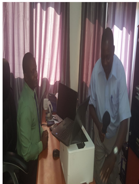
Entrevista na Rádio Moçambique

A Direcção Provincial da Ciência e Tecnologia, Ensino Superior e Técnico Profissional, através do Departamento Provincial de Tecnologia de Informação e Comunicação participou numa entrevista radiofónica na Rádio Moçambique-Delegação de Manica e Rádio Comunitária Gesom, onde o teor era o Estágio do funcionamento da Govnet na Província de Manica. De referir, que essa actividades foi coordenada pela Repartição Provincial de comunicação e Imagem.