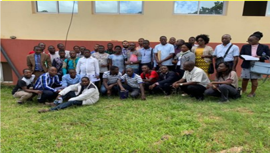
Participantes da Cidade de Chimoio, Distritos de Macate, Gondola e Vanduzi

Capacitação de Professores e Pontos Focais do Programa Criando Cientistas Moçambicano do Amanhã